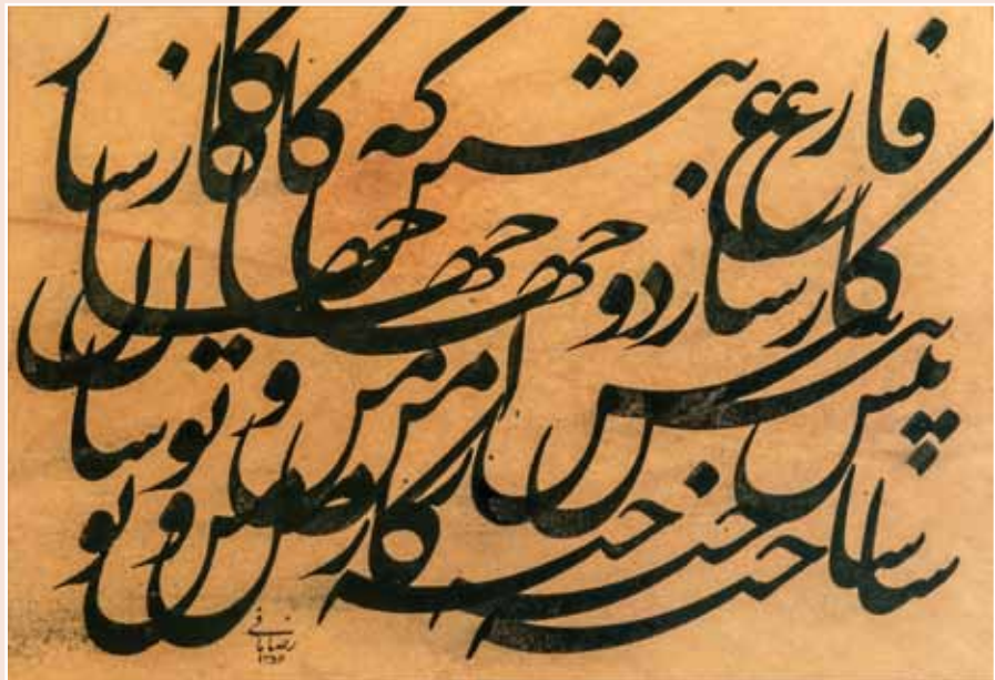
سیاه‌مشق اثر رضا مافی