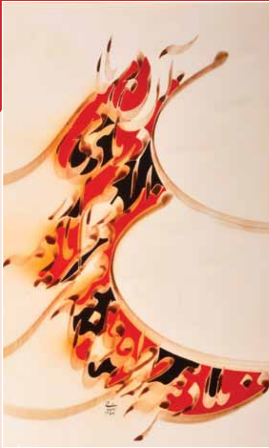
▲ نقاشی خط با خط شکسته اثر رضا مافی