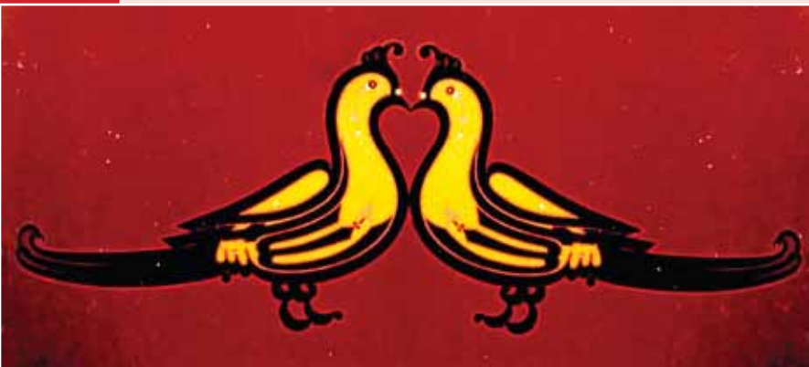
▼ مرغ بسم ... قرینه اثر رضا مافی

در کتاب از نظر به دست دادن نمونه‌هایی از آثار نقاشی خط طراز اول، اهتمام جدی به کار رفته است. خواننده علاقه‌مند در کنار موضوع محوری کتاب، در پس‌زمینه آن می‌تواند نقاشی خط معاصر ایران را همراه با آثار بزرگان آن از نظر تطبیق و مقایسه مطالعه کند. به همین دلیل کتاب علاوه بر شرح و بسط عمیق سلوک رضا مافی، نمایی از نقاشی خط معاصر ایران را نیز به نمایش گذاشته است. با در نظر داشتن اصل مطالعه تطبیقی، نستعلیق استاد مافی با خطوط بزرگانی چون استاد امیرخانی، استاد احصایی، استاد رسولی و استاد خروش مقایسه شده است و تمایزها و تشابهات تا حد امکان با ارائه نمونه‌های لازم به بحث گذاشته شده‌اند.