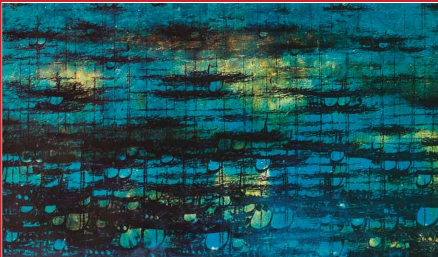
▲ نقاشی خط اثر رضا مافی - اکرولیک روی بوم