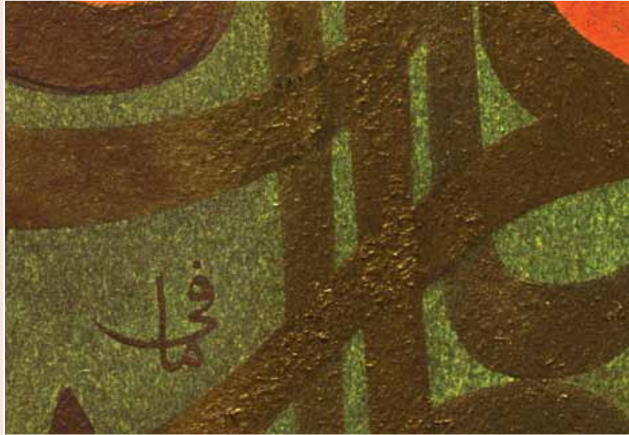
بخشی از نقاشی خط اثر رضا مافی